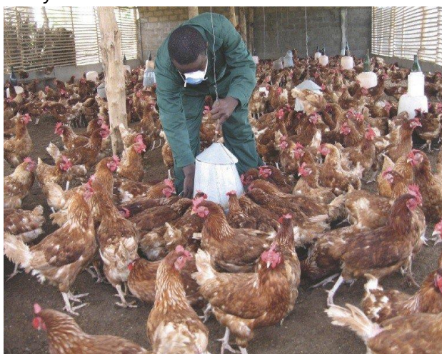
Nigeryjski przemysł drobiarski znajduje się w niepewnej sytuacji, stojąc w obliczu szeregu wyzwań, od rosnących kosztów paszy po dylematy polityczne.

Aby sprostać wieloaspektowym wyzwaniom stojącym przed branżą drobiarską w Nigerii, należy wdrożyć kombinację rozwiązań w gospodarstwie i rozwiązań krajowych. W gospodarstwie rolnym jest to kwestia przywrócenia podstaw poprzez promowanie uprawy kukurydzy i soi w celu zapewnienia stałych dostaw składników paszowych, bez polegania na imporcie. W planach jest również promowanie stosowania alternatywnych składników pasz, które są dostępne lokalnie i opłacalne, a także zachęcanie lokalnych społeczności i rolników do udziału w inicjatywach, które pomagają tworzyć spółdzielnie rolnicze i łączyć zasoby, aby móc kupować środki produkcji po niższych cenach.